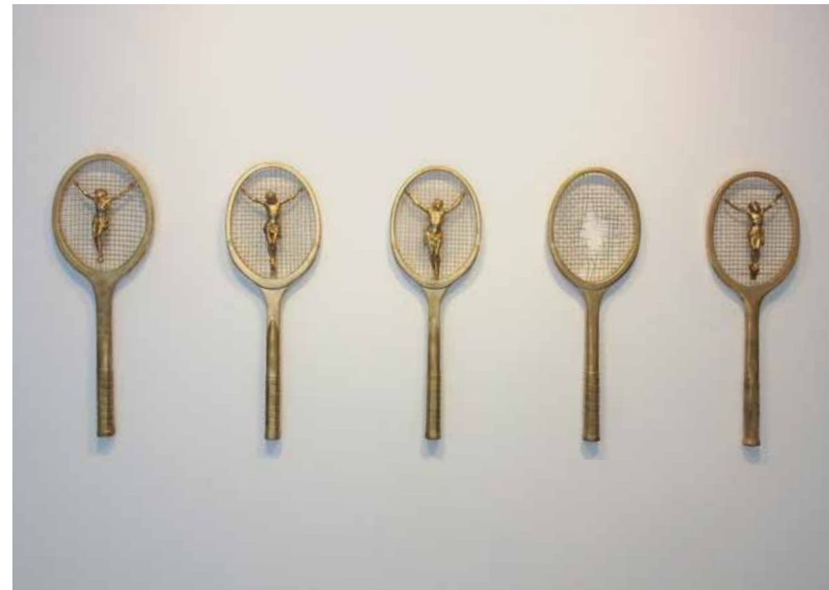
S/T, 2014 Instalación con sonido Técnica mixta Medidas variables