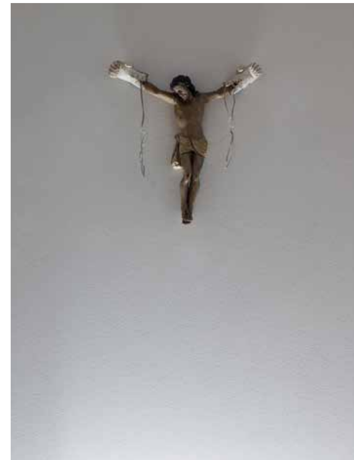
S/T, 2014 Instalación con sonido Técnica mixta 49 x 40 cm.