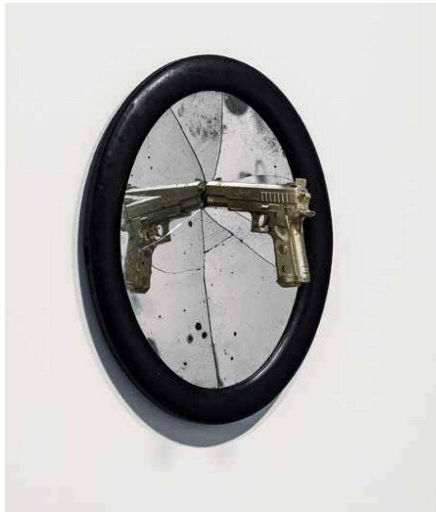
S/T, 2014 Técnica mixta 70 x 52 x 22 cm.