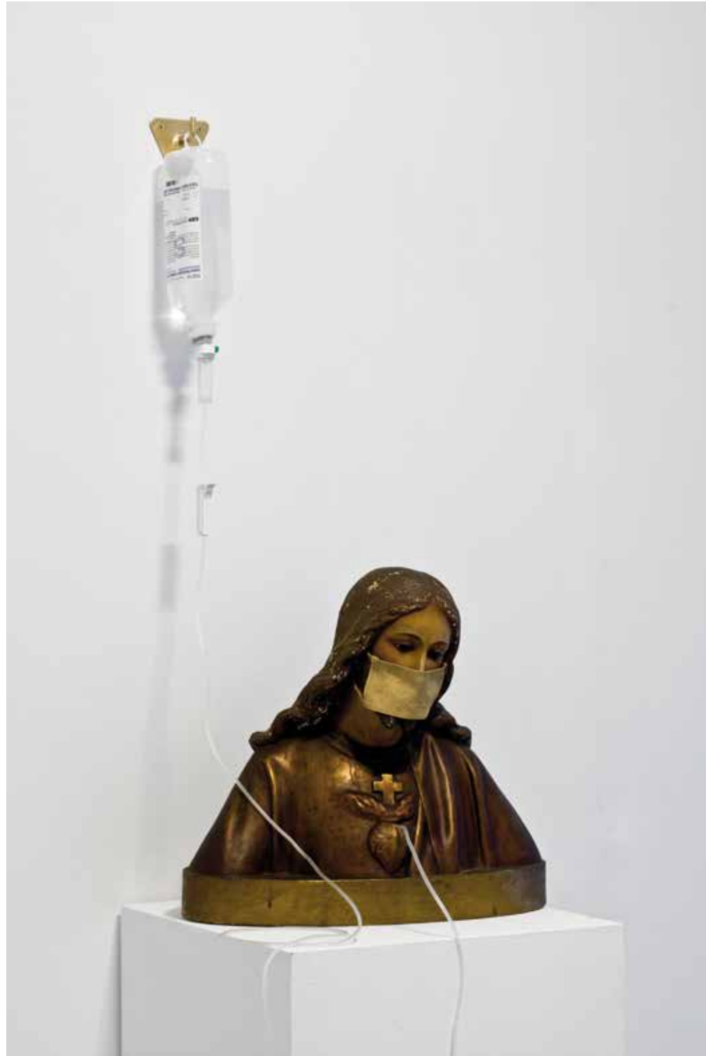
S/T, 2014 Técnica mixta 100 x 45 x 40 cm.