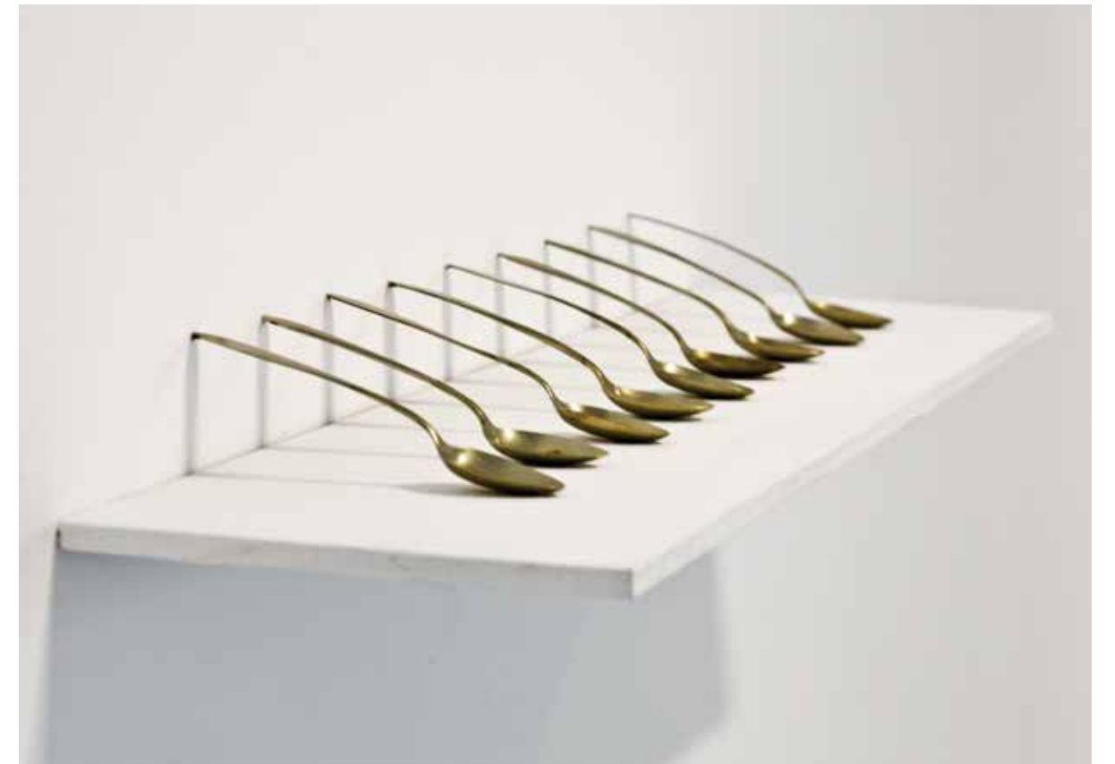
S/T, 2014 Técnica mixta 60 x 25 cm.