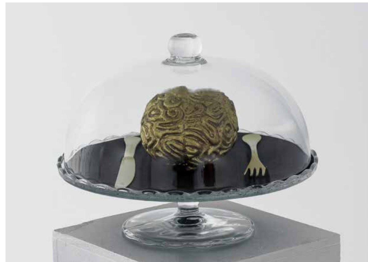
S/T, 2014 Técnica mixta 30 x 30 x 30 cm.