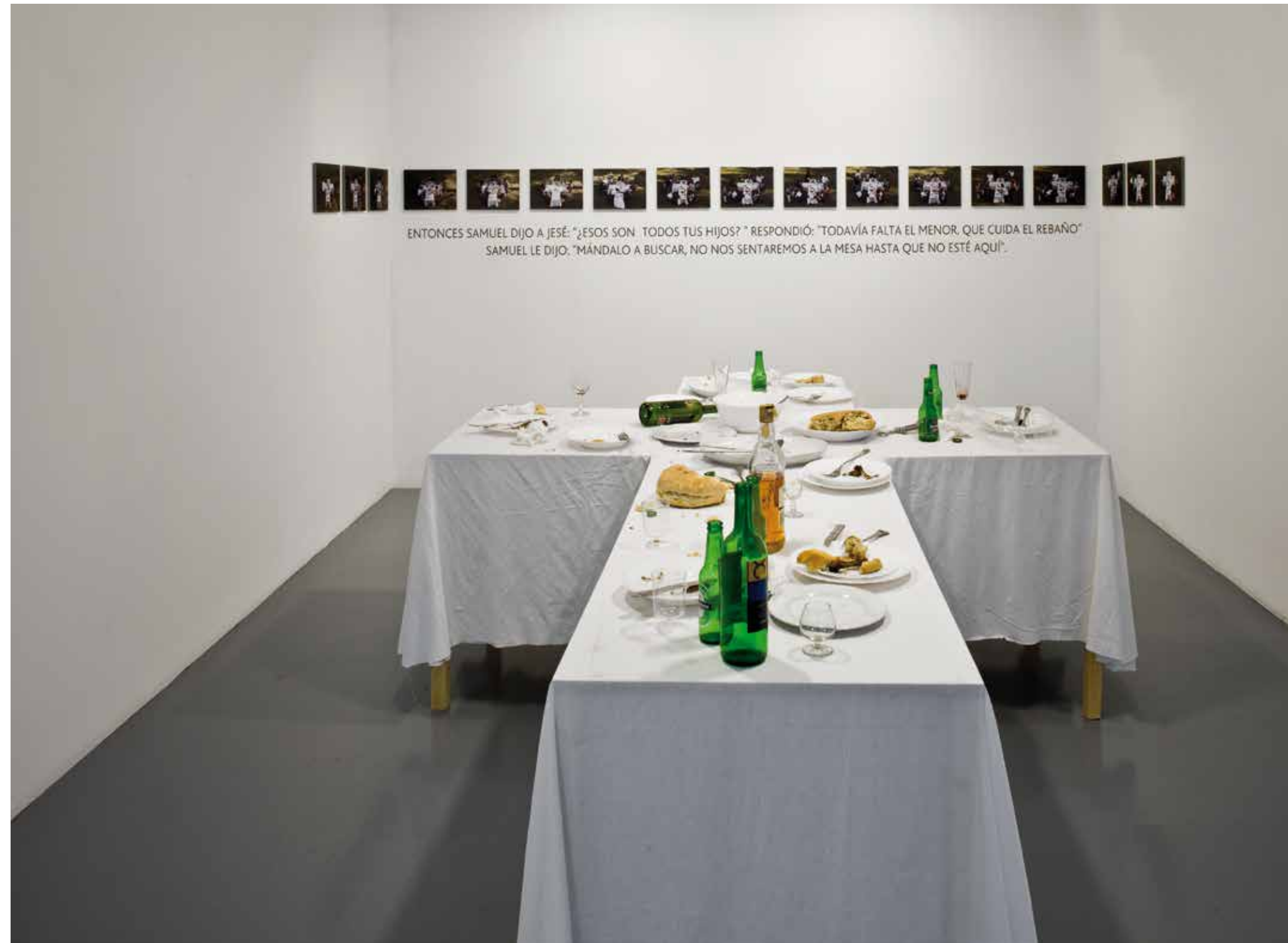
Entonces Samuel dijo a Jesé: "¿Esos son todos tus hijos? respondió: "Todavía falta el menor, que cuida el rebaño" Samuel le dijo: "Mándalo a buscar, no nos sentaremos a la mesa hasta que no esté aquí", 2014 Técnica mixta 320 x 180 x 75 cm.