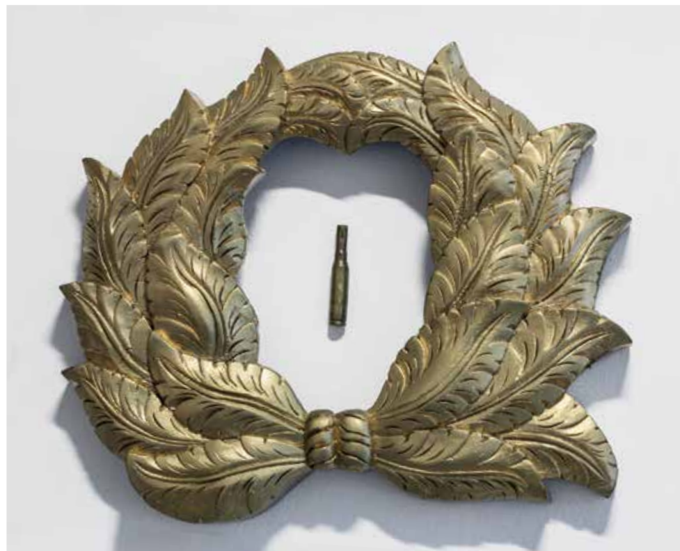
"Monumento a mis oportunidades", 2014 Técnica mixta 35 x 35 cm.