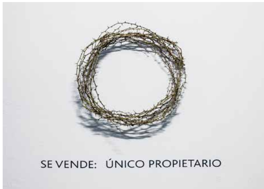
"Se vende: único propietario", 2014 Técnica mixta 60 x 60 cm.