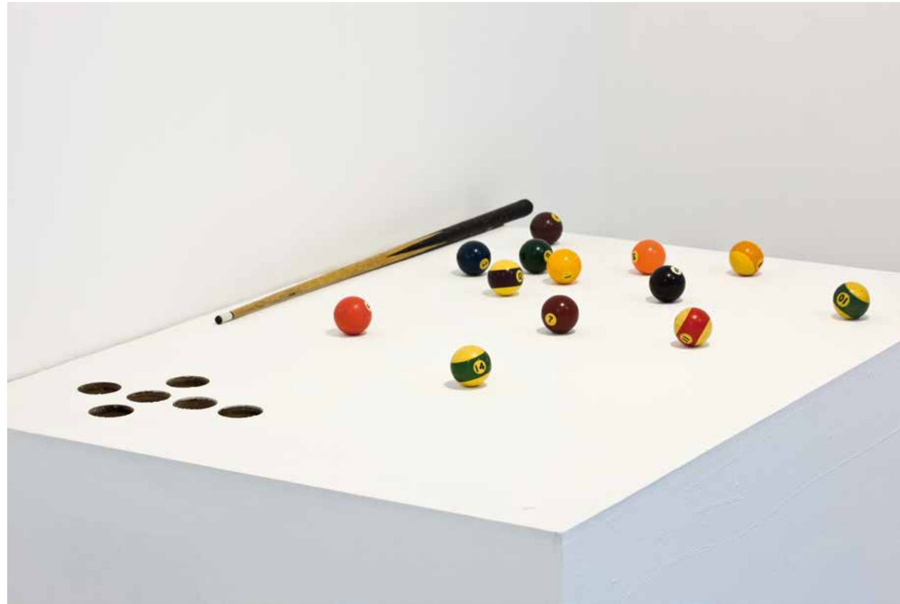
S/T, 2014 Técnica mixta 170 x 120 x 80 cm.