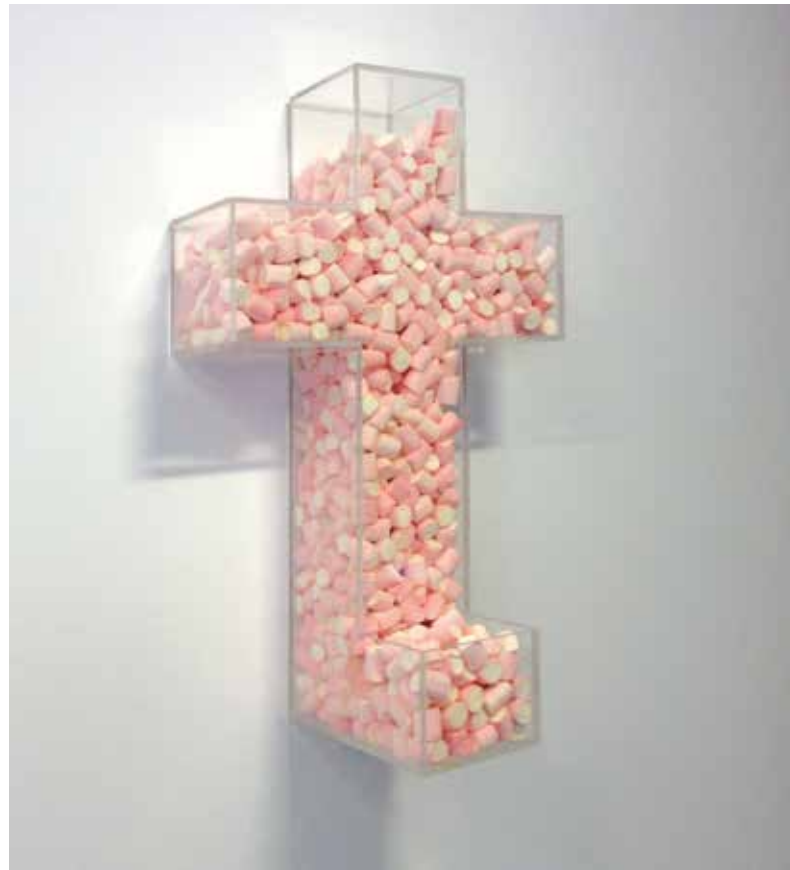
S/T, 2014 Técnica mixta 80 x 60 x 20 cm.