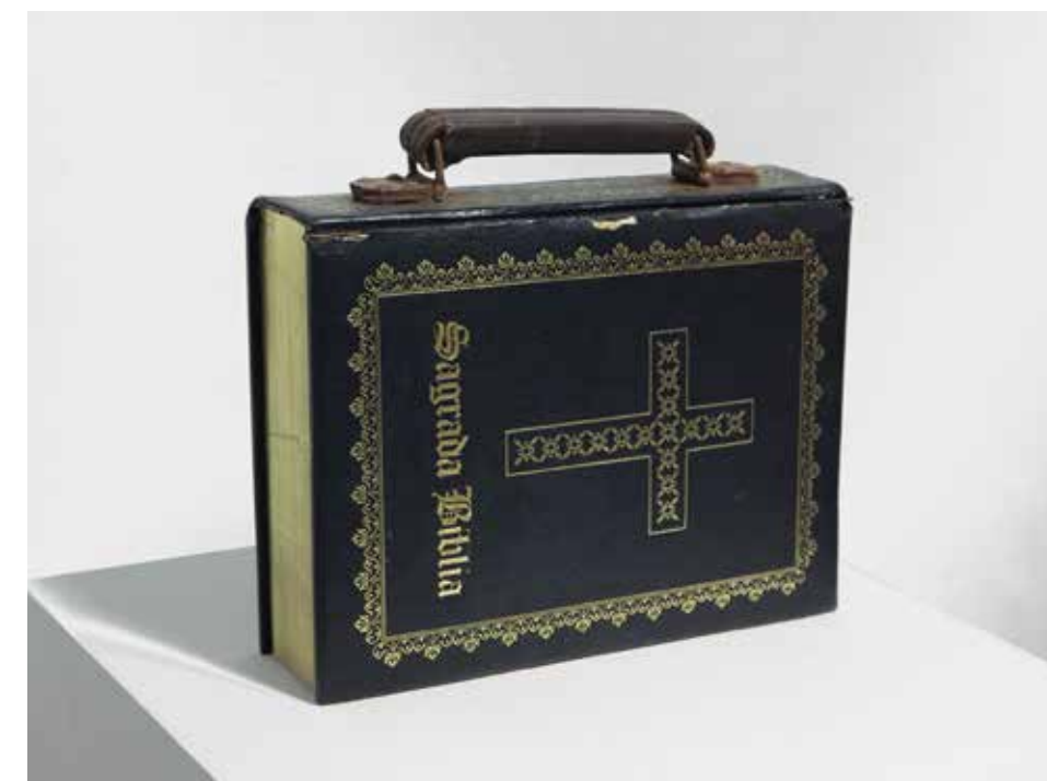
S/T, 2014 Técnica mixta 30 x 25 x 13 cm.